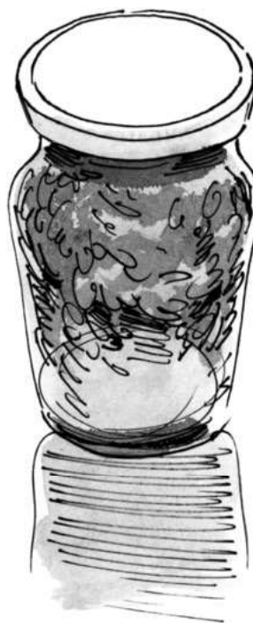
Abb. 1.3: Tinktur

Salbeitinktur eignet sich gut zum Gurgeln bei Halsentzündungen oder zum Spülen des Mundes bei Zahnfleischentzündungen. Dazu gibt man ca. 20–25 Tropfen (oder einige Spritzer) in ein kleines Glas lauwarmes Wasser. Die Tinktur kann auch statt eines Mundwassers genutzt werden, es kräftigt Zähne und Zahnfleisch. Wie bei allen phytotherapeutischen Mitteln muss jedoch nach zwei Monaten eine zweimonatige Pause gemacht werden, damit kein Gewöhnungseffekt eintritt.