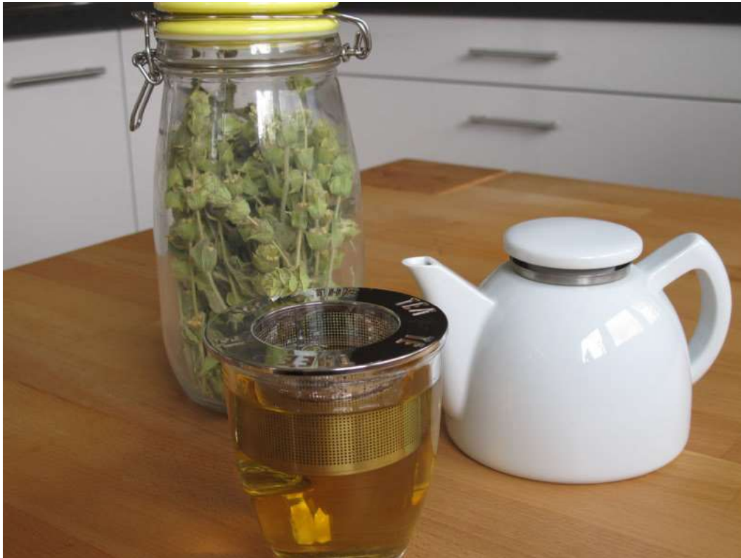
Abb. 1.1: Infus

Für das Anlegen eines Wickels oder einer Kompresse benötigen Sie Sachkenntnisse, die in diesem Kapitel ebenfalls vermittelt werden.