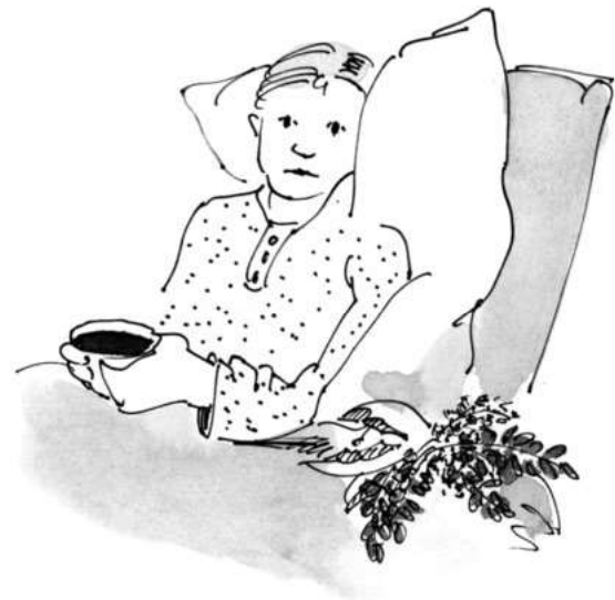
Abb. 1.2: Sitzend und Schlückchen für Schlückchen

Zucker sollte dem Tee nur in Ausnahmefällen zugesetzt werden, denn er mindert die Wirkung. Falls nötig, ist Honig die bessere Alternative, vor allem bei Erkältungskrankheiten und bei Schlaftees. Allerdings sollte er nicht über 42 °C erwärmt werden, da sonst die wertvollen Enzyme zerstört werden. Wenn Honig also direkt in den noch fast kochenden Tee gegeben wird, besitzt er außer dem süßen Geschmack keine Heilwirkung mehr. In den meisten Fällen ist vom Süßen grundsätzlich abzuraten: Bei Tees mit Bitterstoffen würde die Bitterwirkung, auf die es hier ja ankommt und die bereits im Mund